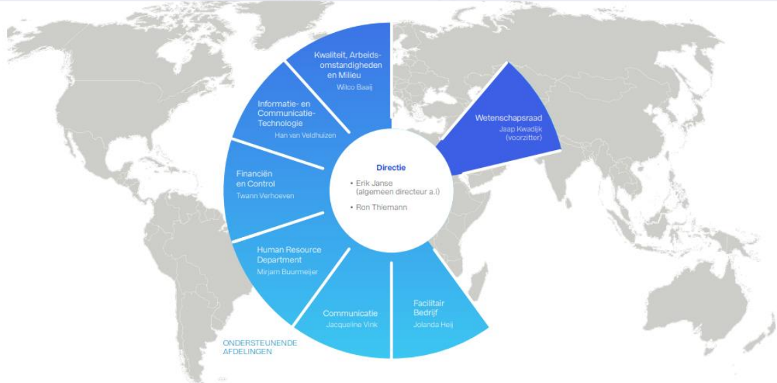
Figuur 1. Organogram Deltares februari 2020.